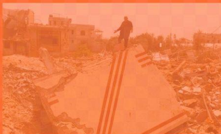
Du projet sioniste au génocide

Bourse du travail (UD CGT 21), 17 rue du Transvaal, 21000 Dijon