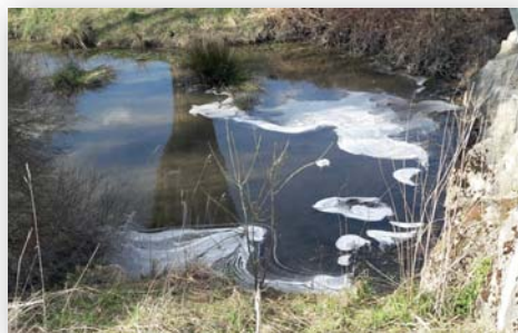
Le Cromois dans tous ses états